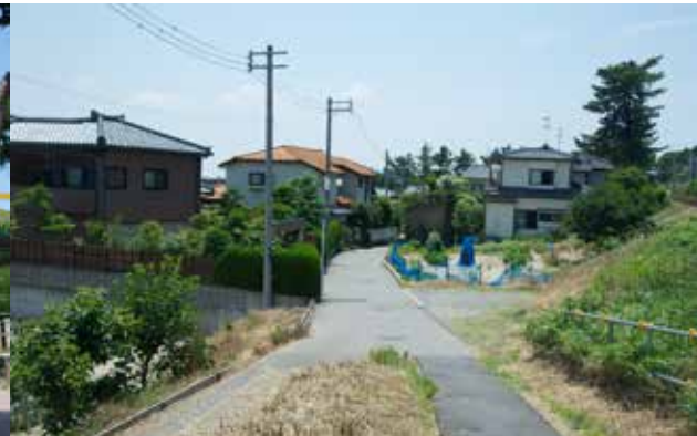
西川街道(北国街道)

寺尾駅周辺には北国街道が通っているのだそうです。西川街道は、西川沿いの北国街道として重要。