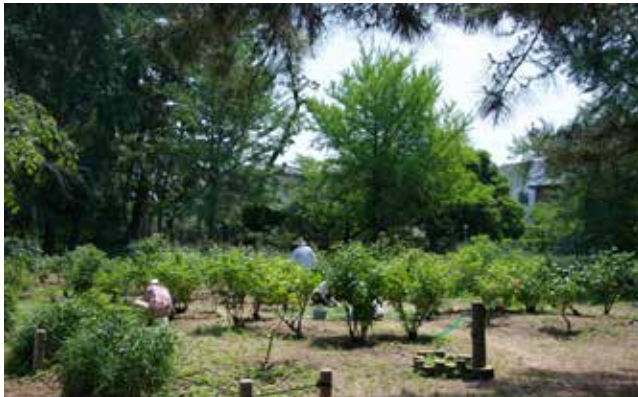
寺尾中央公園のバラ園

公園の中にある二つの小さなバラ園には30種類のバラがあり、春と秋に沢山バラが咲く。